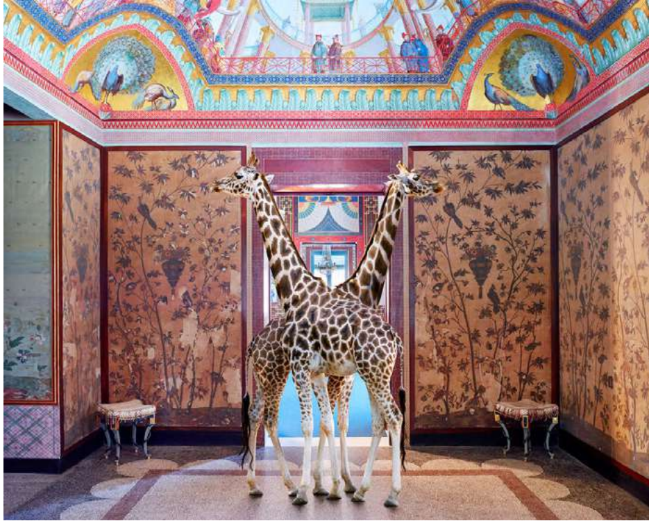
Brief Encounter, Palazzina Cinese, 2018 © Karen Knorr - Courtesy Galerie Les filles du calvaire, Paris.