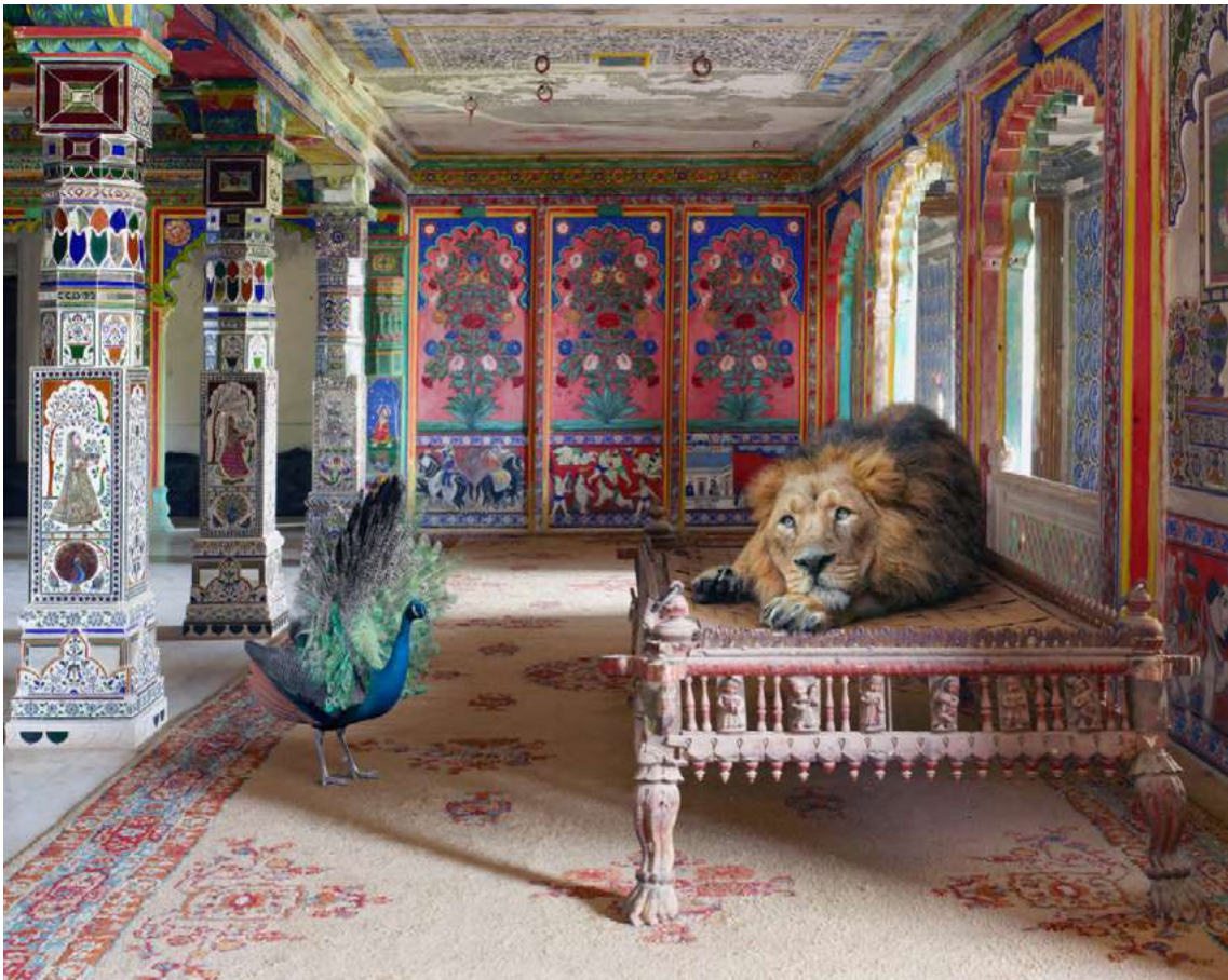
The Lovesick Prince, © Karen Knorr - Courtesy Galerie Les filles du calvaire, Paris.