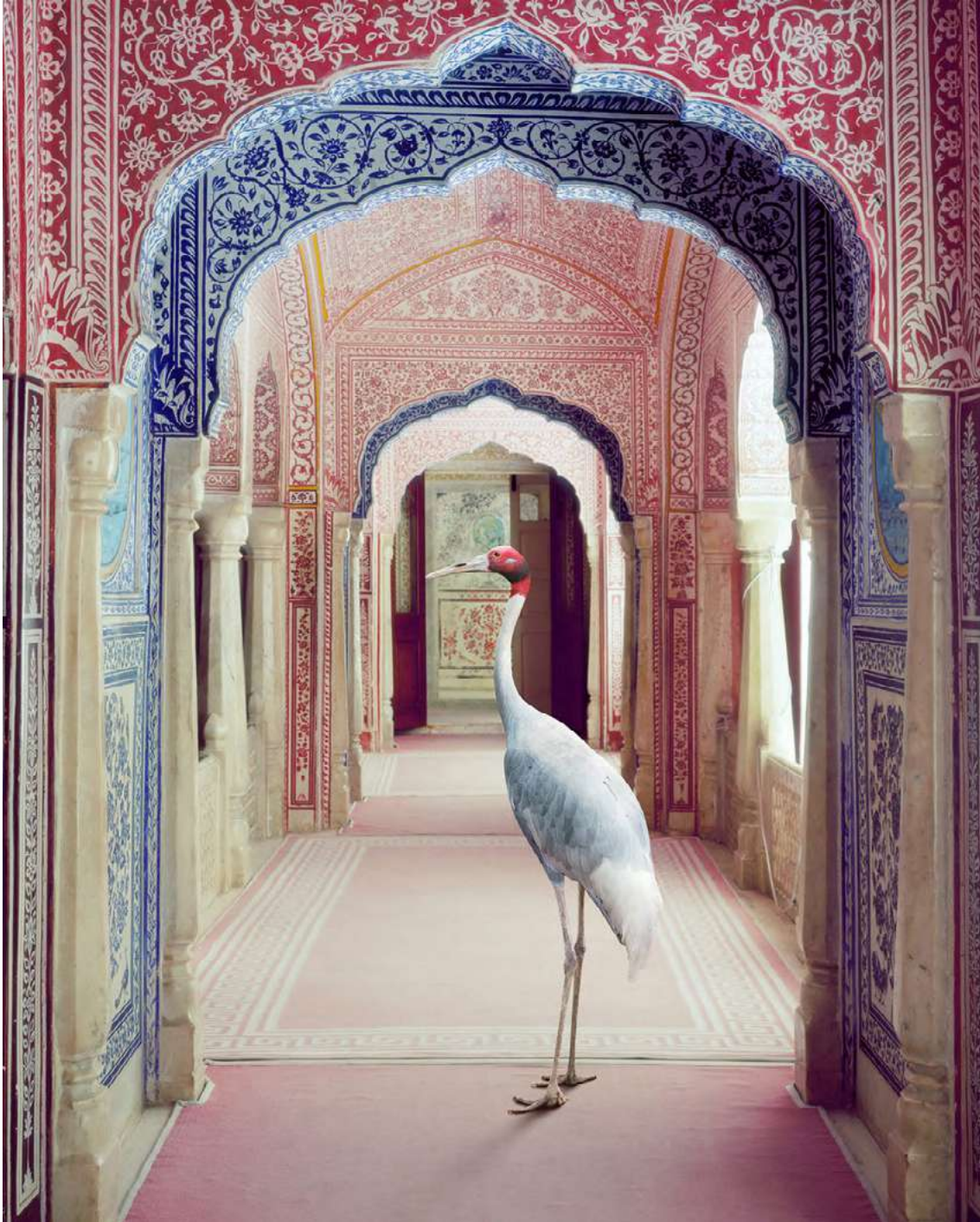
A Faithful Companion , Samode Palace, 2020