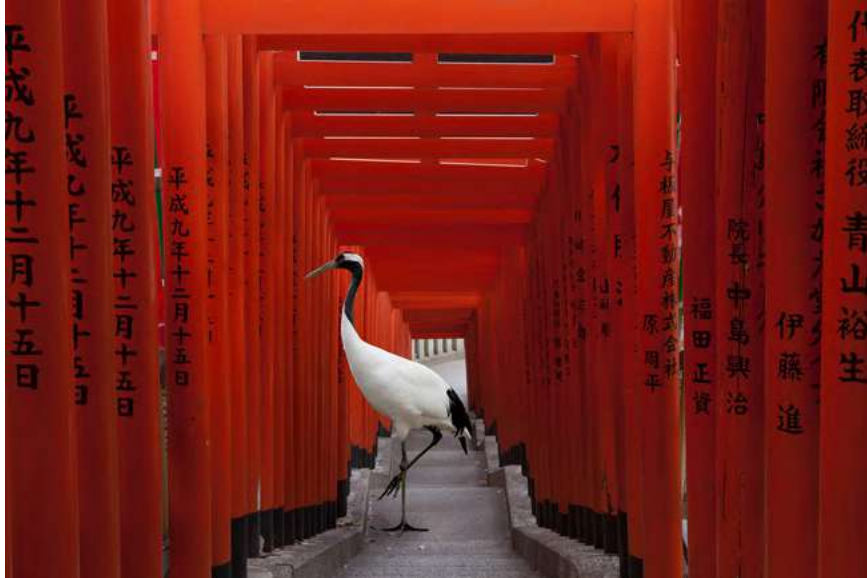
The Journey, Hie Torii, Tokyo, 2015 © Karen Knorr - Courtesy Galerie Les filles du calvaire, Paris.