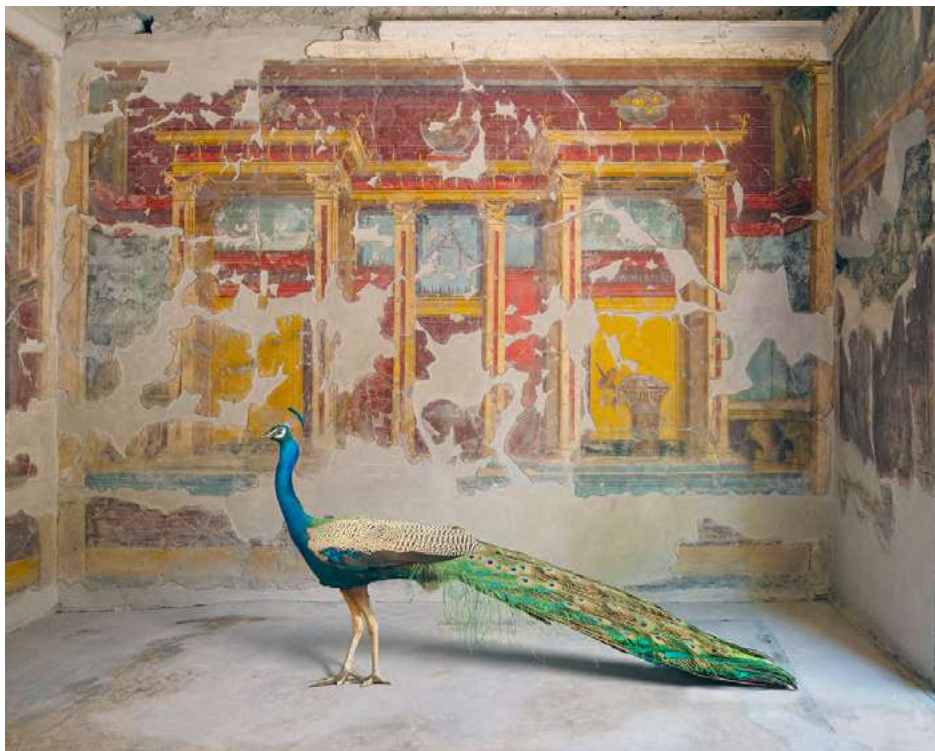
Hera's Eyes, Villa Oplontis