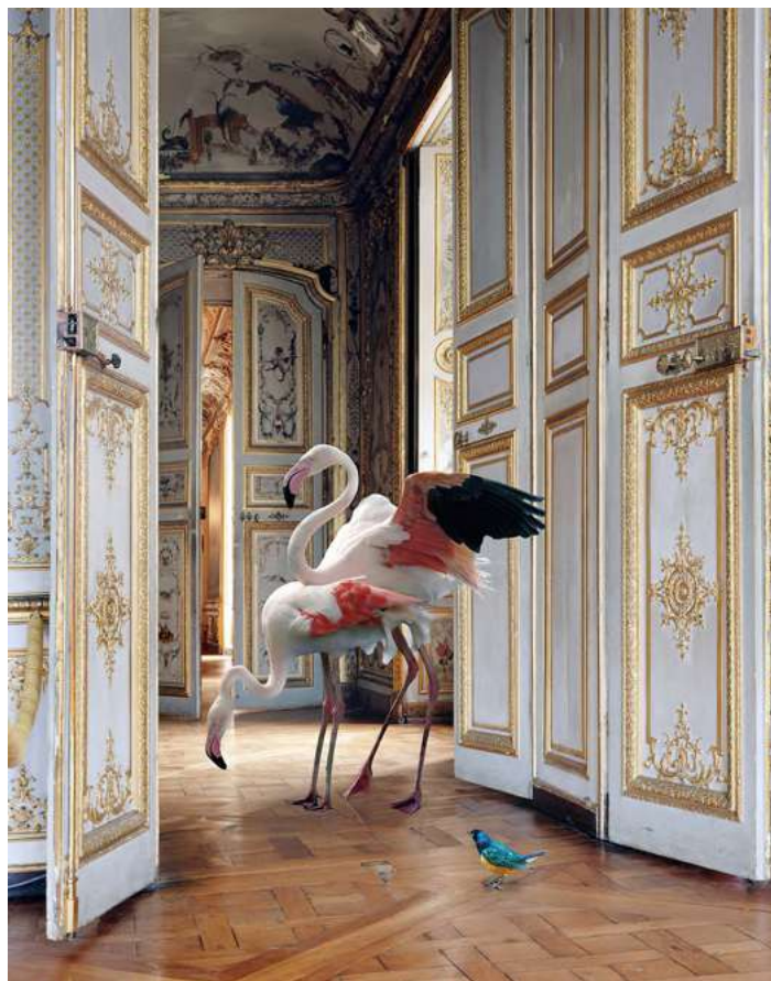
The Grand Monkey Room (2) (Musée Condé, Chantilly), 2006, Série « Fables »

Chaque image est un voyage, un conte visuel où l'art et la culture s'animent à travers des photographies qui interrogent, étonnent et fascinent.